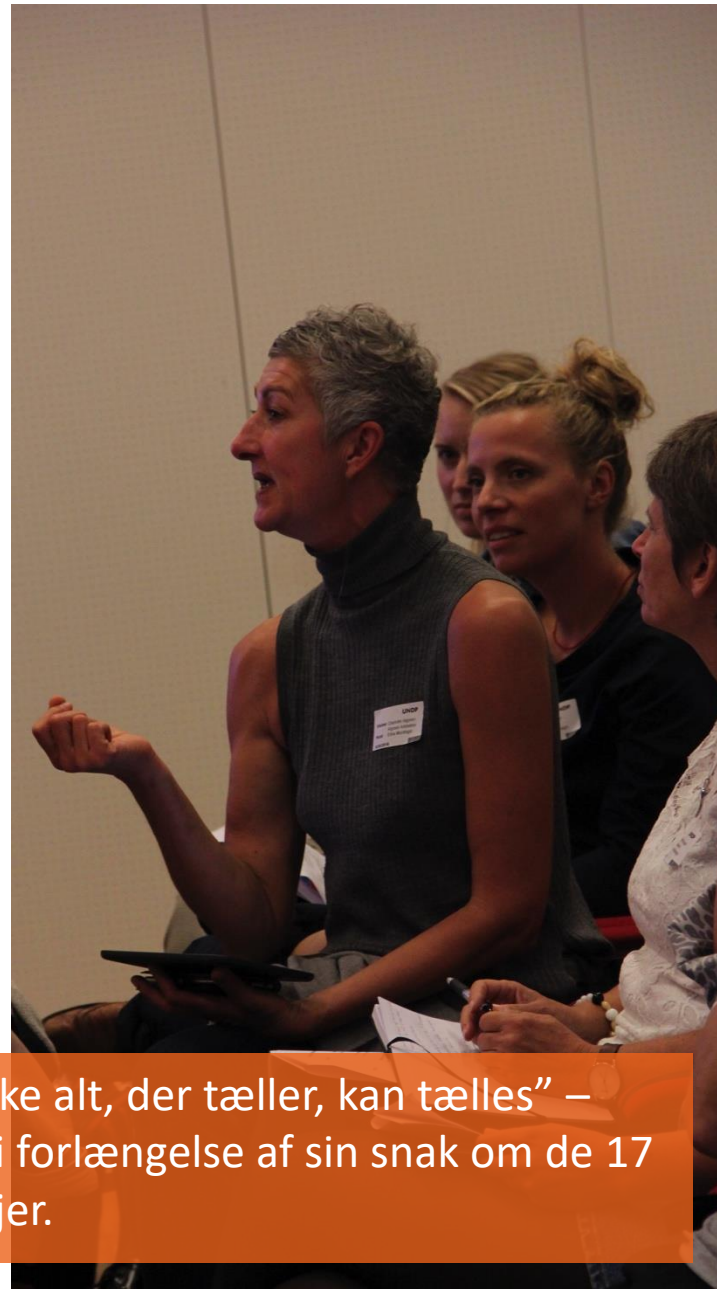
”Ikke alt, der kan tælles, tæller, og ikke alt, der tæller, kan tælles” – Steen Hildebrandt citerede Einstein i forlængelse af sin snak om de 17 verdensmål som alternative bundlinjer.