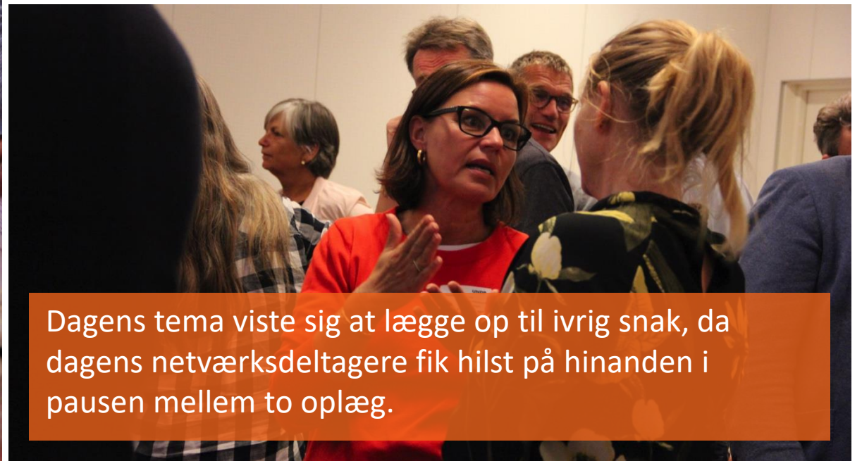
Dagens tema viste sig at lægge op til ivrig snak, da dagens netværksdeltagere fik hilst på hinanden i pausen mellem to oplæg.